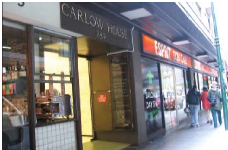
Siedziba „TP” w latach 1984 – 1995, 289 Flinders Lane, Melbourne, widok współczesny

Urządzenie do fotoskładu kosztował dwadzieścia pięć tysięcy dolarów, zakupione było za gotówkę tzn. z dochodów przynoszonych przez pismo. Na offsetową maszynę drukarską, która kosztowała około dwustu tysięcy dolarów nie było już wydawcy stać. Nie odwoływano się do ofiarności społeczeństwa o pożyczki czy dary, wychodząc z założenia, że Tygodnik powinien być finansowo samowystarczalny. Drukowano więc w drukarni offsetowej Westernpoint Publishing Co. Przechodząc na technikę offsetową Tygodnik Polski mógł zwiększyć objętość do szesnastu stron, a z czasem do dwudziestu. Dawało to możliwość zamieszczenia większej ilości ogłoszeń, które stanowiły połowę dochodów, a także więcej tekstów i ilustracji. Zapewniało