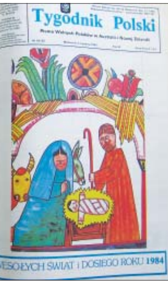
TP nr 50-52, 17 grudnia 1983 r.

Lista nazwisk nie jest pełna, w związku z tym mile będą widziane nadesłane uzupełnienia.