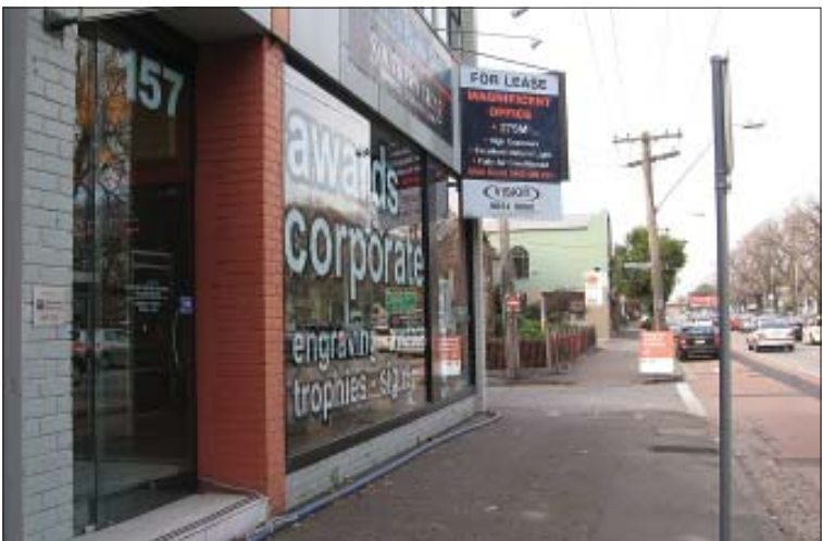
Siedziba „TP” w latach 1995 – 1999, 157 Victoria Parade, Collingwood, widok współczesny

Dziewięcioletnim wydarzeniem dla Polonii australijskiej było przybycie Papieża Polaka do Australii i spotkanie z pięćdziesięcioletnią