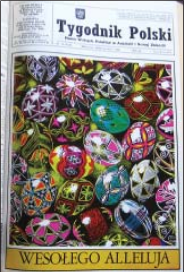
TP nr 13-14, 18-25 kwietnia 1981 r.

Red. Grot-Kwaśniewski tak to sprecyzował: „Do zakresu prac redaktora „Tygodnika Polskiego” należą wszystkie rodzaje pracy dziennikarskiej (włączając redakcję tech-