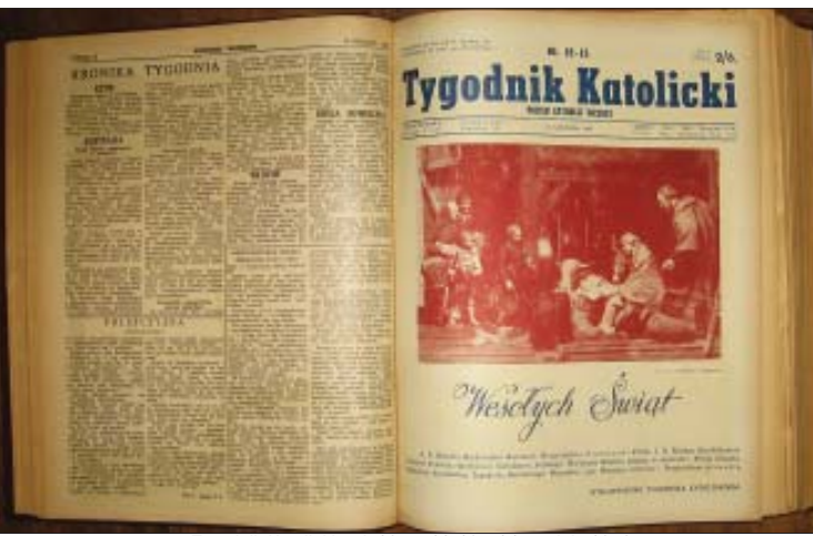
Tygodnik Katolicki, rok 10, nr 12-13 z 24 grudnia 1958 r.