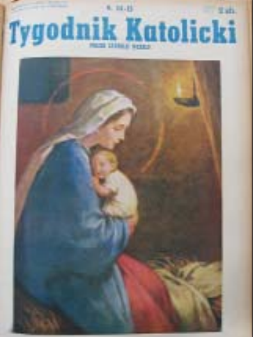
Tygodnik Katolicki, rok 10, nr 51-52, 10 października 1959 r.

Lepiej tego nie można było ująć. Przeglądając archiwalne numery Tygodnika Katolickiego, szczególnie początkowe, gdzie większość tekstów pisze sam ks. Trzeciak, odczuwa się ciepło emanujące z łamów, wtedy jeszcze pismemka i prawdziwą troskę o rodaków osiedlających się w nowym kraju. Rzekniecie „wszystko jest dobre, piękne i pożyteczne”. Książd redaktor ma dar jasnego przekazywania myśli i co zaskakuje – talent literacki. Jego teksty niewiele się zestarzały i jeszcze dziś czyta się je, jak mini nowelki. Natomiast swój artykuł z okazji jubileuszu „Słowo Tymczasowego Redaktora” umieścił skromnie na dwudziestej czwartej stronie. Pisze w nim: