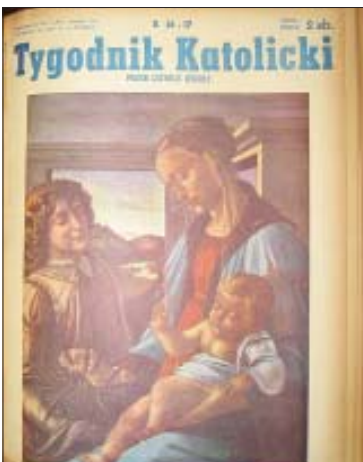
Tygodnik Katolicki, rok 8, nr 16-17, 8 grudnia 1956

„Podobno tak być musi, jednak początkowe trudności i związana z nimi praca tak w redakcji jak i w drukarni nie należały do typu łatwych do pokonania. Pierwsze miesiące te najtrudniejsze minęły jednak szybko mimo różnych chmur i zawodów praca tak w redakcji jak i w drukarni potoczyła się coraz bardziej utartym, normalnym torem. Z biegiem czasu coraz mniej godzin poświęcać musiałem pracy w drukarni a... coraz więcej w redakcji.”