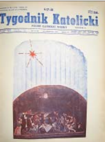
Tygodnik Katolicki, rok 6, nr 17-18, 18 grudnia 1954 r.

Chociaż były duże trudności, nie tylko pieniężne, udało się zakupić na raty, używane maszyny drukarskie i linotyp, a przebudowy i urządzenia hali podjęli się ochotniczo Polacy z Melbourne. Drukarnia była przedsiębiorstwem samodzielnym, nie należała do gazety, która posiadała w niej jedynie udziały. Współwłaścicielami było kilkudziesięciu. Na początku czerwca odbyło się uroczyste poświęcenie nowej siedziby. Kolejny numer wyszedł już w Richmond jako nr 42 z datą 12 czerwca 1954 roku. Sądząc po wyżej przytoczonych danych, można by przypuszczać, że była przerwa tygodniowa w wydawaniu. Jednak po dokładnym sprawdzeniu, okazuje się, że nr 40 też ukazał się z datą 29 maja. Widocznie wkradła się pomyłka do daty numeru 41 – powinien wyjść z datą 5 czerwca, gdyż ciągłość była zachowana.